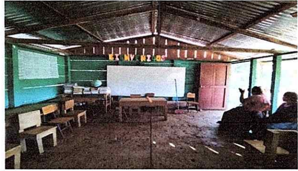
Foto 2: EL PISO DETERIORADO DEL AULA PROVOCA INESTABILIDAD EN LAS MESAS DE TRABAJO; LA ESTRUCTURA DEL TECHO PROVOCA QUE LOS RAYOS DEL SOL PENETREN. DENTRO DEL AULA