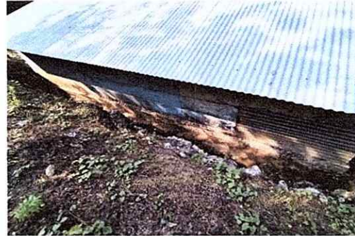
Foto 4: LOS ESPACIOS ABIERTOS SUELEN SER CUBIERTOS CON LAMINA PARA LO CUAL SURGE LA IDEA DE REMODELACIÓN DEL EDIFICIO ESCOLAR.