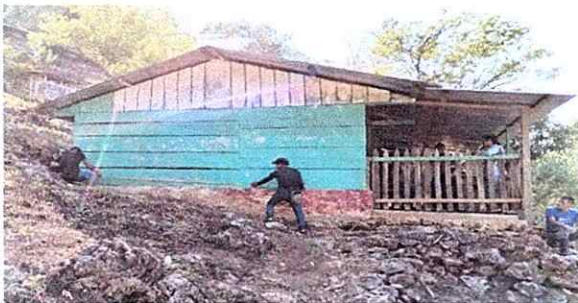
Foto 5: SE PROCEDE A TOMAR MEDIDAS PARA REALIZAR LOS PLANOS CORRESPONDIENTES PARA REMODELACIÓN.