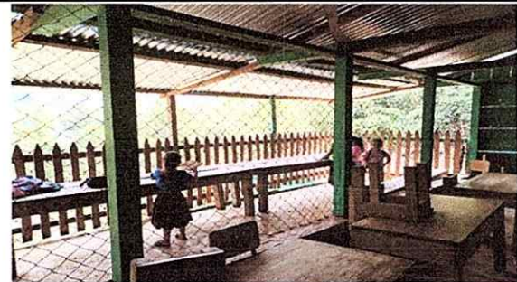
Foto 6: LA ESCUELA NO CUENTA CON VENTANAS ADECUADAS Y LOS RAYOS DEL SOL ALCANZAN A LOS ALUMNOS EN LAS PRIMERAS HORAS DE LA MAÑANA.

Observación: Si es necesario se pueden agregar hojas adicionales y actualizar el número de hojas.