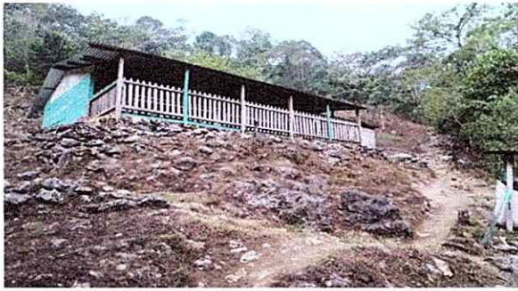
Foto1: EN ESTA FOTOGRAFÍA PODEMOS APRECIAR LA ESCUELA UBICADA EN UN ESPACIO ROCOSO DE ALTURA, VULNERABLE A CIERTOS DESASTRES NATURALES.